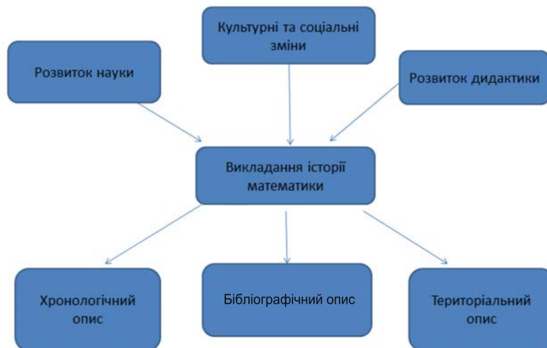
Рис. 2. Структурна схема викладання історії математики

На рисунку 2 представлено основні чинники які впливали на формування викладання історії математики та методи його викладання.