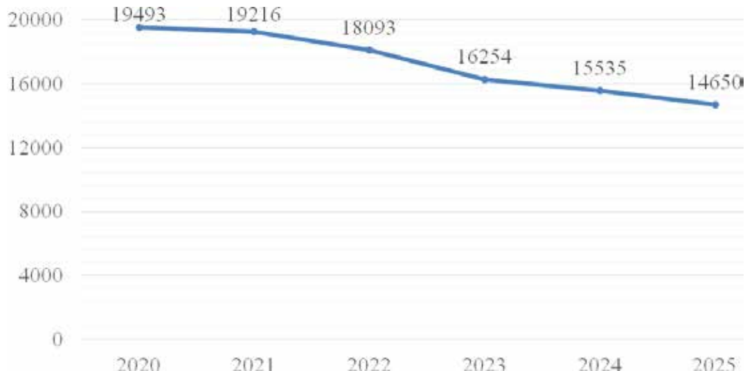
Рис. 2. Кількість педагогічних працівників закладів позашкільної освіти, за даними Міністерства освіти і науки України, 2020–2025 рр.

Значною є проблема молодих педагогічних працівників закладів позашкільної освіти та педагогів чоловічої статі, які мають організувати освітній процес у гуртках науково-технічного, військово-патріотичного, туристсько-краєзнавчого та фізкультурно-спортивного напрямів позашкільної освіти (табл. 2).