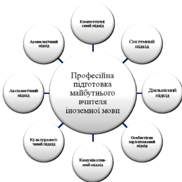
Рис. 1. Методологічні підходи до неперервної професійної підготовки майбутнього вчителя іноземної мови, використані в дослідженні

Найбільш вагомими, на нашу думку, є компетентнісний та системний підходи (О. Куц, В. Маслов, Л. Сущенко, Ю. Шкреттїй та ін.). Із модернізацією освіти акцентується увага на компетентностях, а результати професійної підготовки фахівців оцінюються через сукупність відповідних компетенцій, які формуються, актуалізуються й активізуються саме в діяльності. Компетентнісний підхід був об'єктом дослідження у працях К. Білової, І. Лернера, В. Краєвського та їх послідовників, а також у наукових розвідках Б. Вольфсона, Д. Гришина, О. Дубасенюк, В. Лозової, О. Малихіна, О. Подмазіна, А. Хуторського та ін. Освітніми цілями визначаються ключові