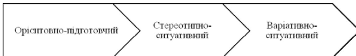
Рис. 2. Рівні формування мовно-комунікативної компетентності майбутніх учителів початкових класів

Ці рівні набуття компетентності є важливим орієнтиром для майбутніх учителів початкової школи на шляху від базових знань до просунутої комунікативної майстерності. Усвідомлення цих етапів розвитку дає змогу укладачам освітніх програм ефективніше підтримувати вчителів у вдосконаленні їхньої мовно-комунікативної компетентності.