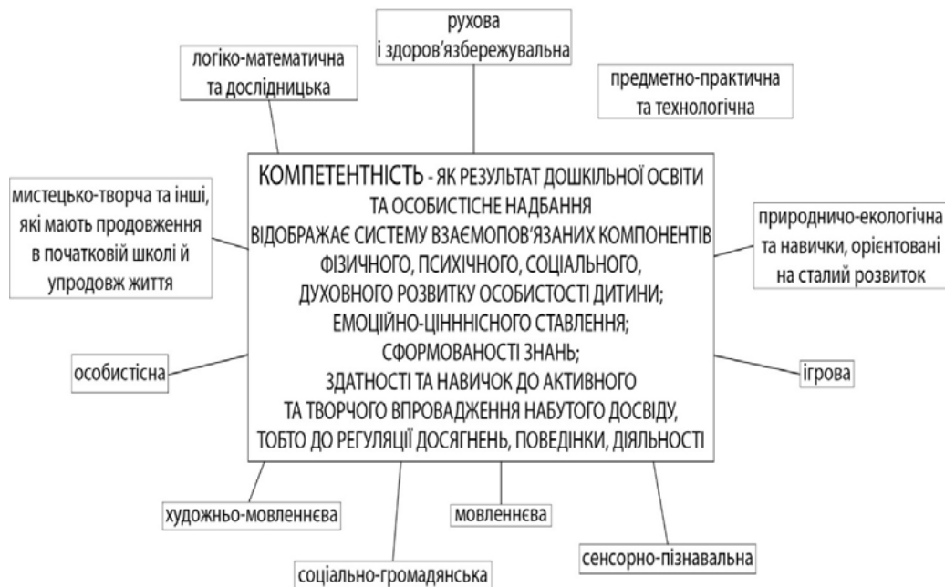
Рис. 2. Ключові компетентності дитини дошкільного віку

Ключовими компетентностями дитини дошкільного віку в Державному стандарті визначені: рухова і здоров'язбережувальна, особистісна, предметно-практична та технологічна, сенсорно-пізнавальна, логіко-математична та дослідницька, природничо-екологічна та навички, орієнтовані на сталий розвиток, ігрова, соціально-громадянська, мистецько-творча та інші, які мають продовження в початковій школі й упродовж життя (рис. 2) [2].