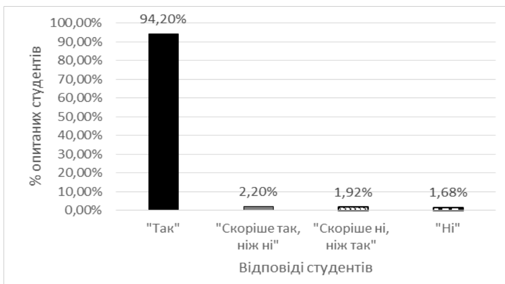
Рис. 2. Суб'єктивне сприйняття студентами важливості формування готовності до іншомовної комунікації в роботі за фахом

Що стосується другого питання анкети – «Чи важливим є для Вас формування готовності до іншомовної комунікації?», то переважна більшість студентів коледжу вважають, що володіння іноземною мовою є для них важливим (94,2 % опитаних). Окрім цього, 2,2% респондентів, що не дали виразно позитивної відповіді на це запитання анкети, все ж таки відповіли у позитивному аспекті – вони позначили формування готовності до іншомовної комунікації скоріше важливим, ніж неважливим. Цей показник ілюструє рис. 2.