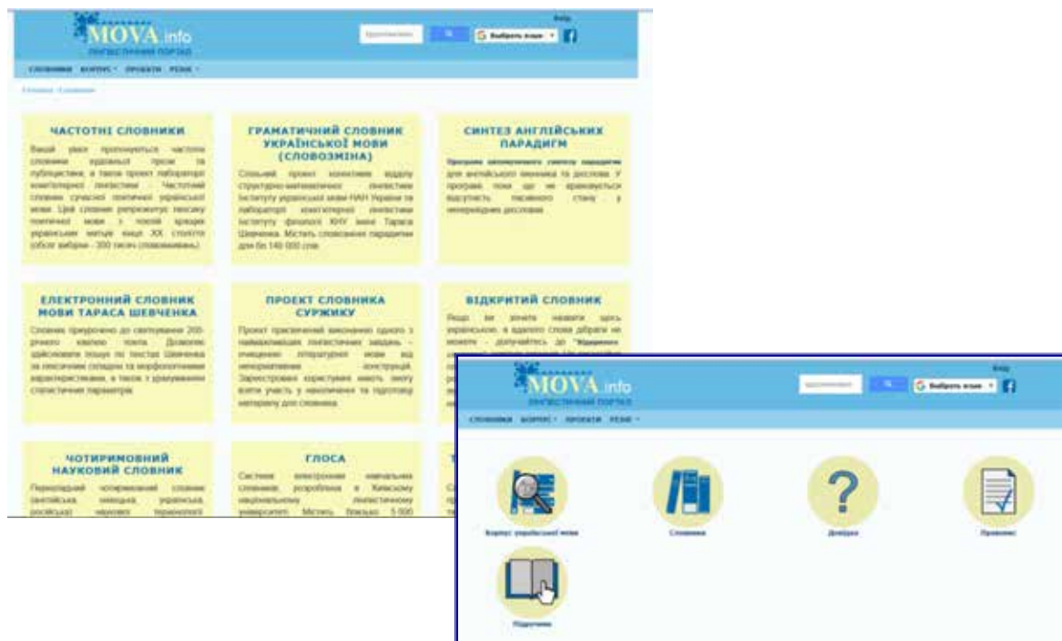
Рис. 1. Інтерфейс лінгвістичного порталу MOVA.info

У процесі професійної підготовки фахівців філологічних дисциплін пропонується використання різноманітних порталів, зокрема Мова.інфо – лінгвістичний портал, який надає можливість: отримувати консультації та роз'яснення з питань, пов'язаних з українською мовою; розміщувати наукові статті, монографії, підручники, бюлетені та інші матеріали наукового характеру, пов'язані з лінгвістикою; отримувати безкоштовний доступ до інформаційних ресурсів (корпус української мови, електронні словники тощо). На цьому порталі пропонуються сайти, безпосередньо пов'язані з різними аспектами функціонування української мови у реальному та віртуальному світах; мовні ресурси від освітянсько-новинних до розважальних (рис. 1).