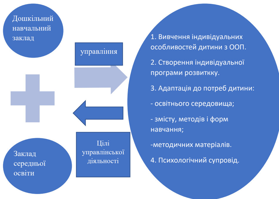
Рис. 3. Модель наступності у створенні інклюзивного освітнього середовища між дошкільним навчальним закладом і закладом загальної середньої освіти.

На основі вище визначеного, нами було узагальнено матеріал щодо наступності у створенні інклюзивного освітнього середовища між дошкільним навчальним закладом і закладом загальної середньої освіти і представлено їх у вигляді моделі (рис. 3).