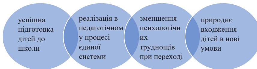
Рис. 2. Значення наступності в інклюзивному освітньому середовищі

Вважаємо, що забезпечення принципів наступності для дітей з особливими освітніми потребами створює успішну підготовку дітей до школи, реалізацію динамічної та перспективної системи виховання і навчання, яка забезпечує формування особистості, природного входження дітей в нові умови, що сприяє підвищенню ефективності навчання, поступове розкриття потенціалу дитини з ООП, зменшення психологічних труднощів та навантаження при переході до нових умов навчання (рис. 2).