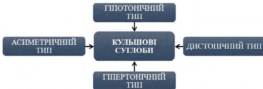
Рис. 1. Блоки порушень у кульшових суглобах