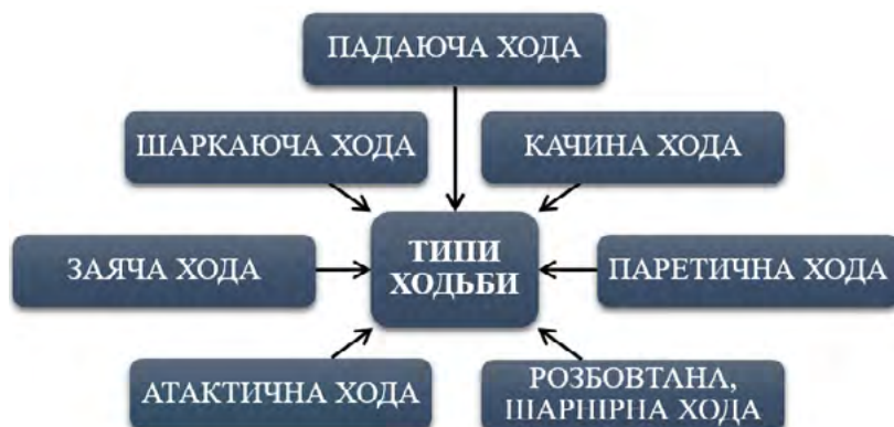
Рис. 4. Блоки порушень ходьби

– ходьба відображає вищезгадане порушення, будучи результатом поєднання анатомо-біомеханічних особливостей у різних біоланках нижніх кінцівок. На основі аналізу літературних даних та багаторічних власних спостережень нами було виділено такі блоки порушення ходьби (рис. 4):