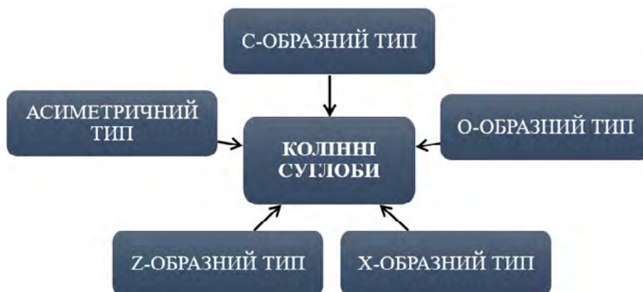
Рис. 2. Блоки порушень у колінних суглобах