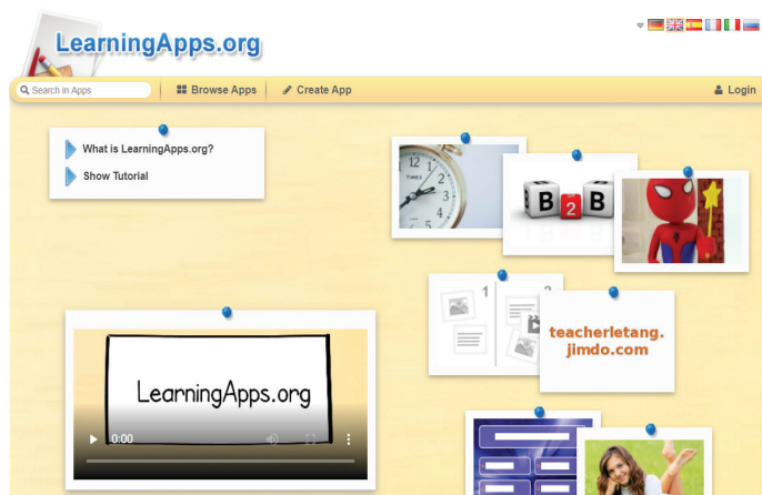
Рис. 1. Web-сервіс LearningApps.org

Для вирішення цих питань на допомогу нам приходять web-сервіс LearningApps.org, який викладачі Криворізького медичного коледжу використовують під час вивчення загальноосвітніх та професійно орієнтованих дисциплін. Ознайомимося з можливостями сервісу LearningApps.org [10].