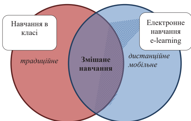
Рис. 1. Місце мобільного навчання в системі освіти