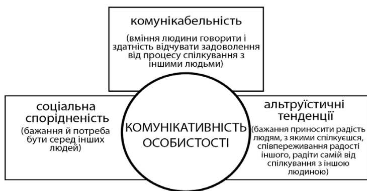
Рис. 3. Структура комунікативності особистості

1) контактна функція – встановлення контакту як стану обопільної готовності до прийому й передачі інформації й підтримки взаємозв'язку;