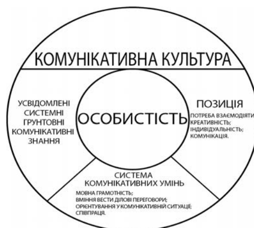
Рис. 2. Комунікативна культура вихователя закладу дошкільної освіти

У свою чергу, Ю. Ханін [8] комунікативність визначає як єдність трьох складників: потреби у спілкуванні, емоційного стану до, під час і після спілкування, комунікативних навичок і вмінь.