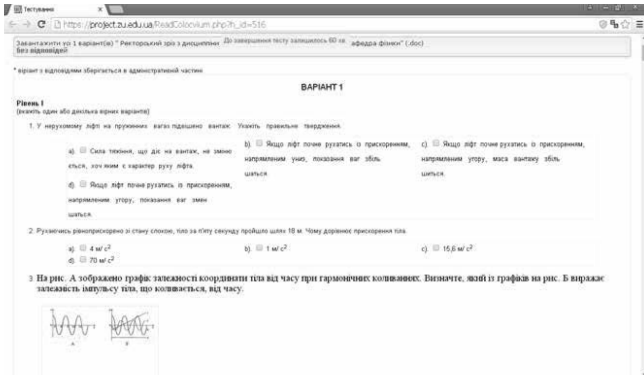
Рис. 3. Згенерований варіант тесту

Оскільки тестова база містить якісні, розрахункові, графічні, експериментальні, комбіновані завдання різних рівнів складності та різних форм, то можна стверджувати, що вона є достатньо ефективною в побудові рейтингової системи оцінювання навчальних досягнень майбутніх учителів фізико-математичного профілю з погляду об'єктивності, справедливості і забезпечення рівного доступу всіх, хто бажає здобути вищу освіту.