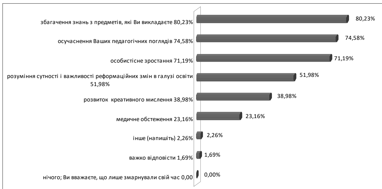
Рис. 1. Результати навчання слухачів на курсах підвищення кваліфікації

Результати соціологічних досліджень, проведених лабораторією соціології та розвитку освіти Волинського ІППО, свідчать про те, що серед результатів навчання на курсах підвищення кваліфікації у ВІППО слухачі називають збагачення знань із предметів, що викладають (80,2 %), осучаснення педагогічних поглядів (74,6 %), особистісне зростання (71,2 %) тощо (див. рис. 1).