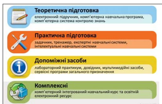
Рис. 2. Класифікація електронних засобів навчання