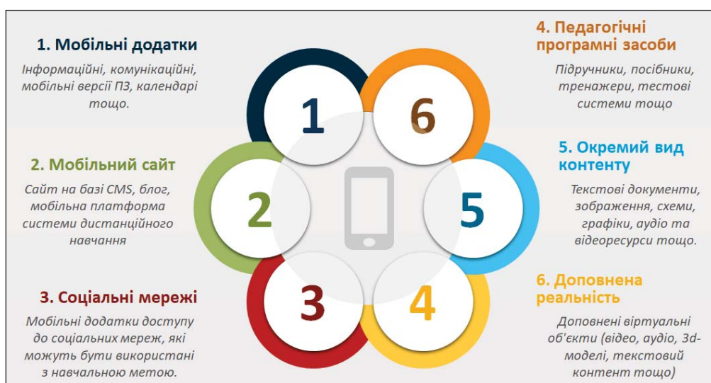
Рис. 4. Мобільні засоби змішаного навчання