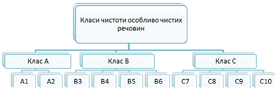
Рис. 3. Розподіл особливо чистих речовин на класи

Для більш детального оволодіння цими поняттями можна запропонувати розподіл особливо чистих речовин (рис. 3).